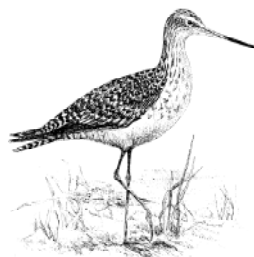
Días de la Aguja (Limosa)

Somos una comunidad. Los Arcatianos participan activamente y se involucran en eventos comunitarios. Las actividades de vecindarios y de interés, están ciudadanos que se preocupan lo responsabilidades y trabajar juntos.